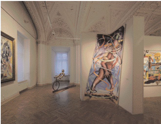
Экспозиция Музея Людвига в Русском музее

сти и создания единой картины современного этапа развития культуры. Стремление музея современного искусства выйти за пределы традиционного статичного музейного показа, расширить область своей деятельности, создать условия для более широкого понимания современной художественной культуры за счет активного включения зрителя в процесс музейной коммуникации — впервые получило воплощение в созданном в Париже двадцатью годами ранее Национальном центре искусства и культуры имени Жоржа Помпиду (Musée National d'Art Moderne — Centre Georges Pompidou), или Центре Бобур (Centre Beaubourg; 1977). Людвиг-форум в Аахене сознательно ломает традиционные музейные представления, отказывается от привычной упорядоченности и систематичности любого рода (хронологической, тематической и т. п.) и провоцирует столкновения различных культурных дискурсов в пространстве Людвиг-форума. Таким образом, создается то современное музейное интерактивное пространство, которое перестает быть нейтральным вместилищем объектов искусства, но само обретает качества активного участника культурного обмена 10 .