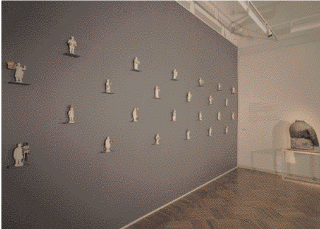
Экспозиция Музея Людвига в Русском музее