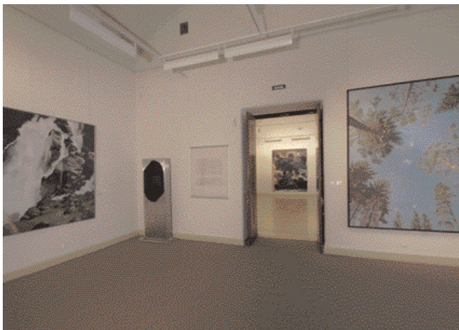
Экспозиция Музея Людвига в Русском музее

надлежит первенство в выработке того принципа показа, который оказался доминирующим при экспонировании большинства мировых коллекций искусства модернизма и остается таковым по сей день.