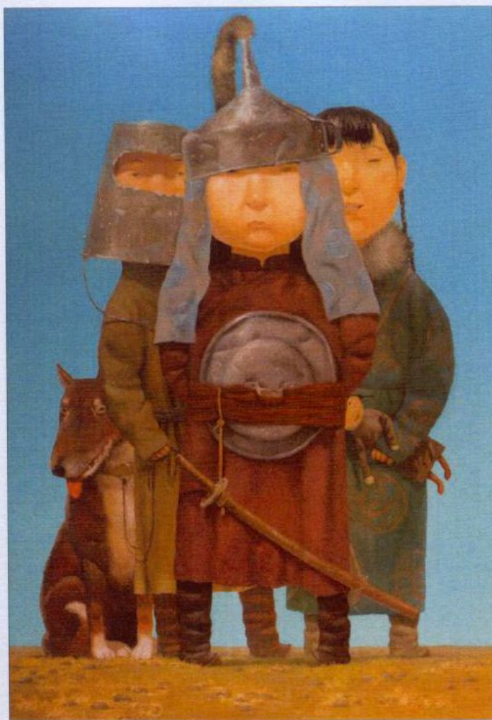
З. Доржиев. Игра II. 2008. Х., м., 80 x 56