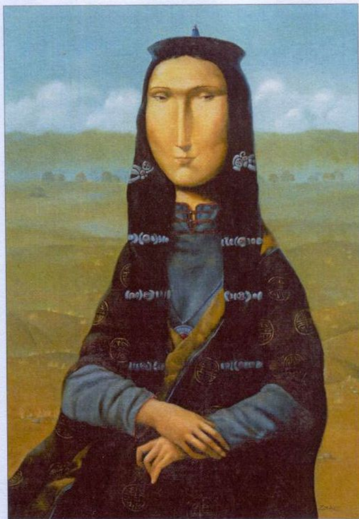
З. Доржиев. Джоконда-Хатун. 2007. Х., м., 80 x 55