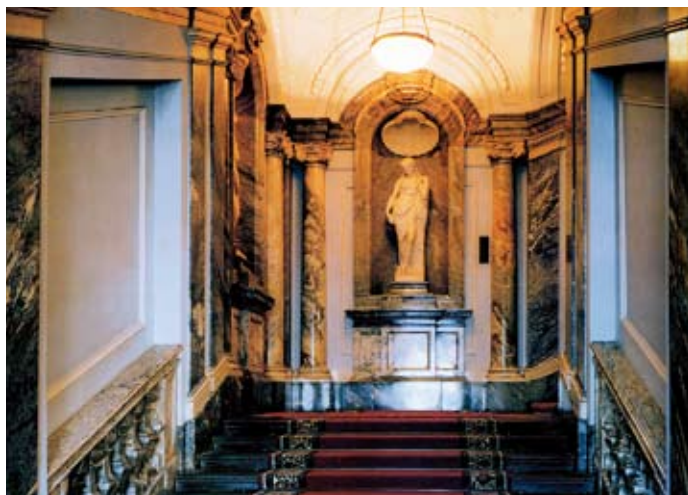
Мраморный дворец. Музей Людвиг в Санкт-Петербурге

В открывшемся в 1991 году в Аахене Людвиг-форуме интернационального искусства тенденции к расширению функций музейного пространства проявились еще более отчетливо. Это уже не столько музей, сколько культурный центр, где проводятся разнообразные мероприятия. Появление и широкое распространение культурных центров в последней трети XX века, в которых коллекции и экспозиции заняли