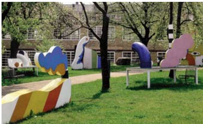
Людвиг-форум в Аахене