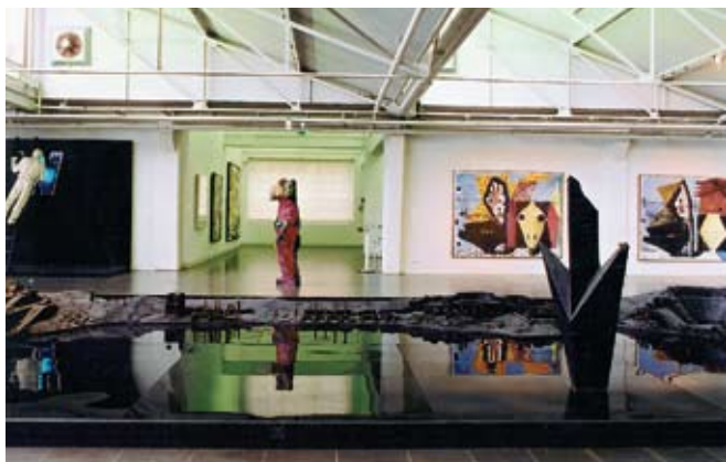
Людвиг-форум в Аахене