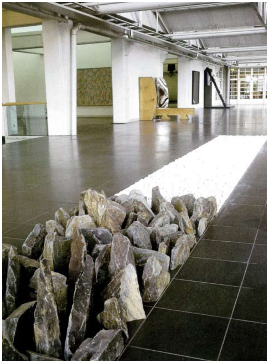
Людвиг-форум в Аахене

Музей современного искусства Петера и Ирэн Людвиг – сложно-организованная система, каждый элемент которой имеет свои особенности, но выражает общие идеи и цели, к которым относятся и развитие международных культурных отношений, и стремление соответствовать тенденциям времени, и открытость для изменений. В уставе Фонда Людвигов особенно подчеркивается направленность проекта в будущее. Реакция на вызов времени – один из главных принципов деятельности Людвигов. Поэтому основная цель фонда – не сохранение коллекции Людвигов как некоего статичного памятника, а следование любым начинаниям, которые представляются современными, продуктивными и направленными в будущее. Таким образом, система музеев Людвиг является развивающейся институцией. Это «открытый» проект: по определению незавершенный, ориентированный на интерактивность международных художественных и культурных процессов, предусматривающий возможность радикальных концептуальных и иных модификаций, что соответствует новейшим представлениям об образе музея современного искусства.