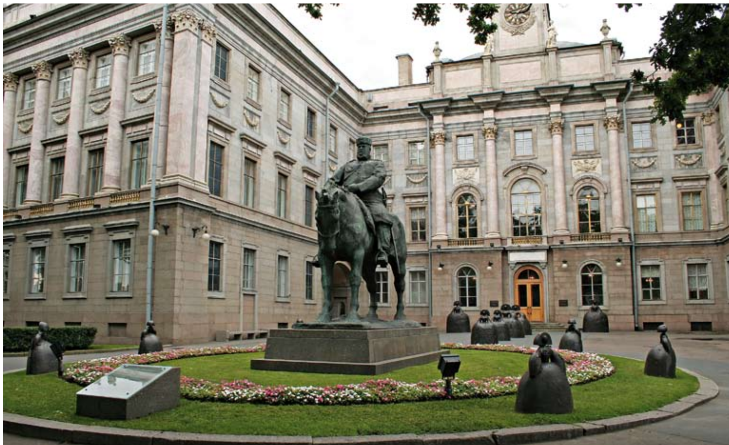
Мраморный дворец. Музей Людвига в Санкт-Петербурге.

Число музеев современного искусства в мире растет в геометрической прогрессии. Однако на сегодняшний день существуют всего две международные системы музеев современного искусства: Гугенхайма и Людвига. Обе созданы по частной инициативе, и в основе обеих концепций – авангардное понимание художественного процесса как постоянно обновляющегося и основанного на эксперименте, программной устремленности в будущее. Особенность музеев Людвига – их «институциональная открытость»: часть из них интегрирована в другие музеи, в том числе основанный в 1995 году в Санкт-Петербурге Музей Людвига в Русском музее.